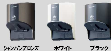
シャンパンブロンズ ホワイト ブラック