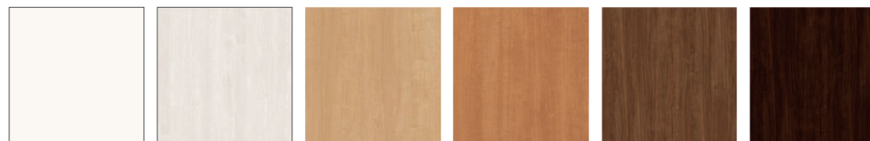
YY/プレシャスホワイト WA/クリアアイボリー PP/クリアベール LL/クリアラスク MM/クリエモカ DD/クリエダーク ※ LAB・LGB デザインにはプレシャスホワイト色(YY)の設定はありません。