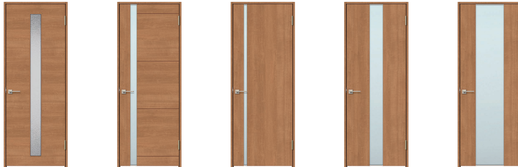
LGB 6 カスミガラス

6 透明、カスミ、エッチング、チェッカー、アンティーク、モールの6種類から変更可能 2 透明、エッチングから変更可能