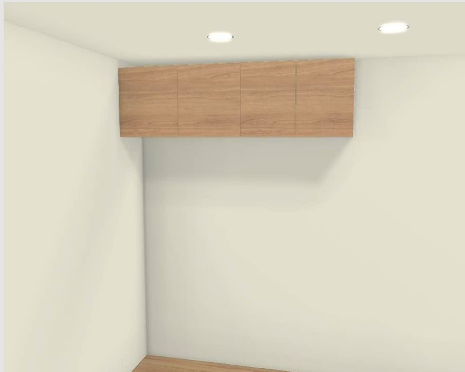
実物を撮影した画像ではないため、実物と異なる場合があります。 見積記載品以外はイメージです。