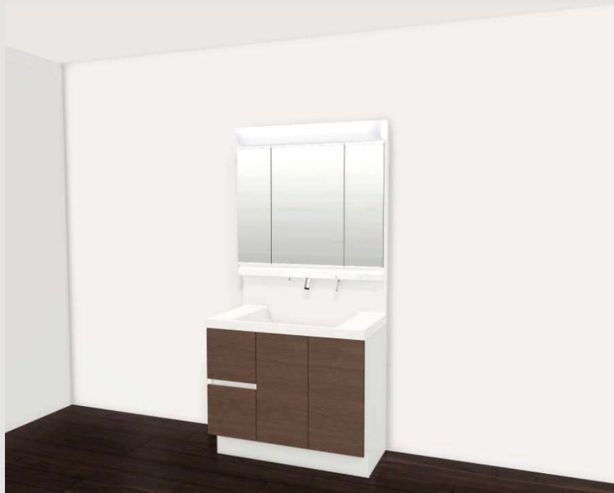
06合戦によるイメージ画像です。